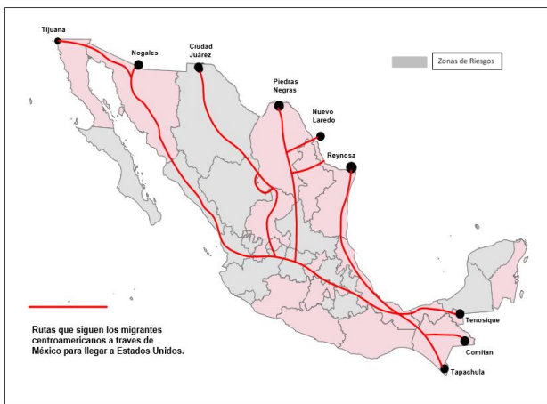
Mapa 3. Zonas de riesgos para migrantes en tránsito por México.