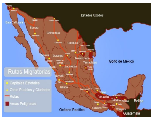
Mapa 2 Ruta hacia Estados-Unidos