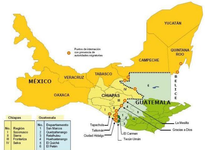
Mapa 1 Entrada en la frontera Sur de México.

condiciones de vida, fueron detenidos principalmente en los municipios de Tenosique, Balancán, Centro y Huimanguillo.